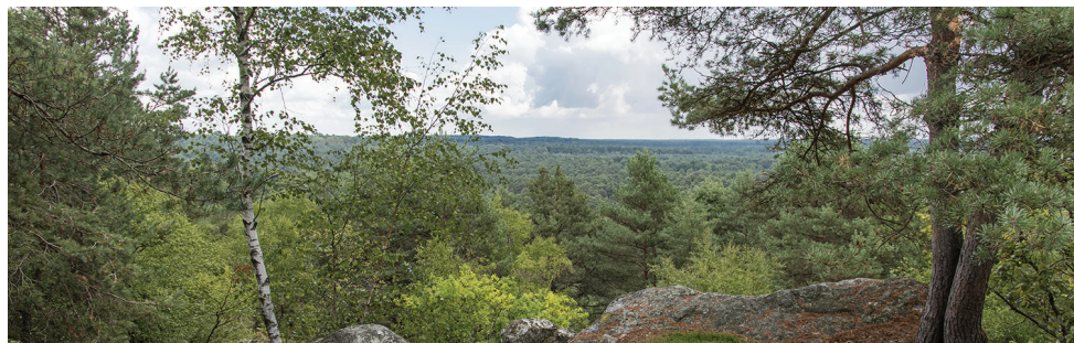
Forêt pionnière de pins et de bouleaux. Point de vue du Rocher de Bouigny en direction des Placereaux, forêt de Fontainebleau.

*et aujourd'hui renommée Union mondiale pour la nature.