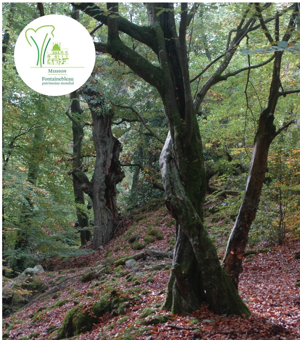
Hêtraie calcicole, réserve biologique intégrale du Gros Fouteau, forêt de Fontainebleau.